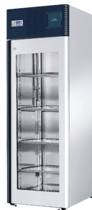
專業冷藏冰箱 (520 Liters)