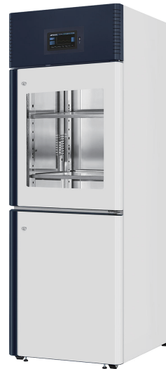
專業半凍半藏冰箱(350/350 Liters)